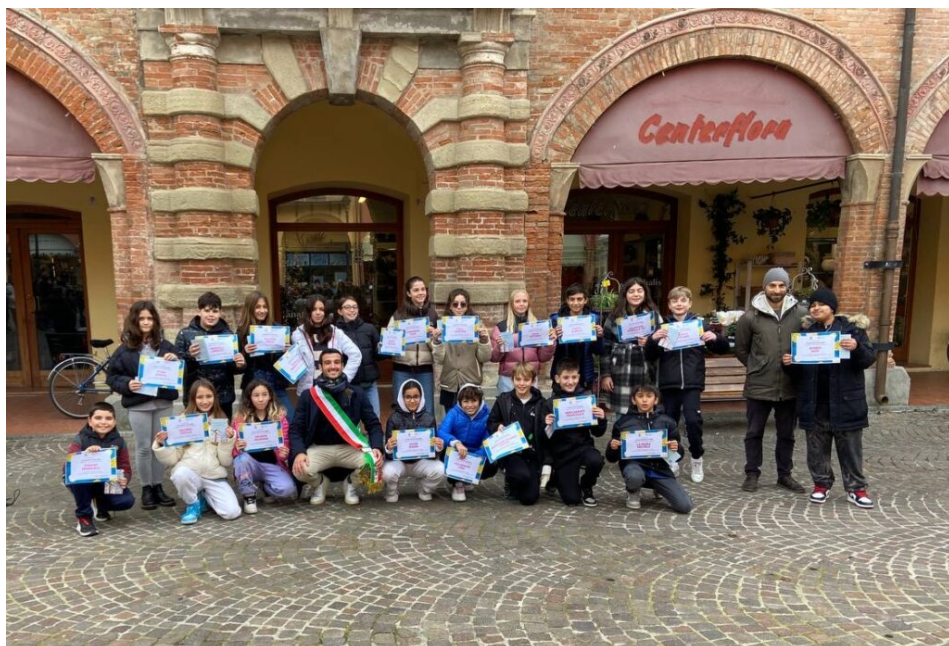
Commissione 3 - Sociale e volontariato