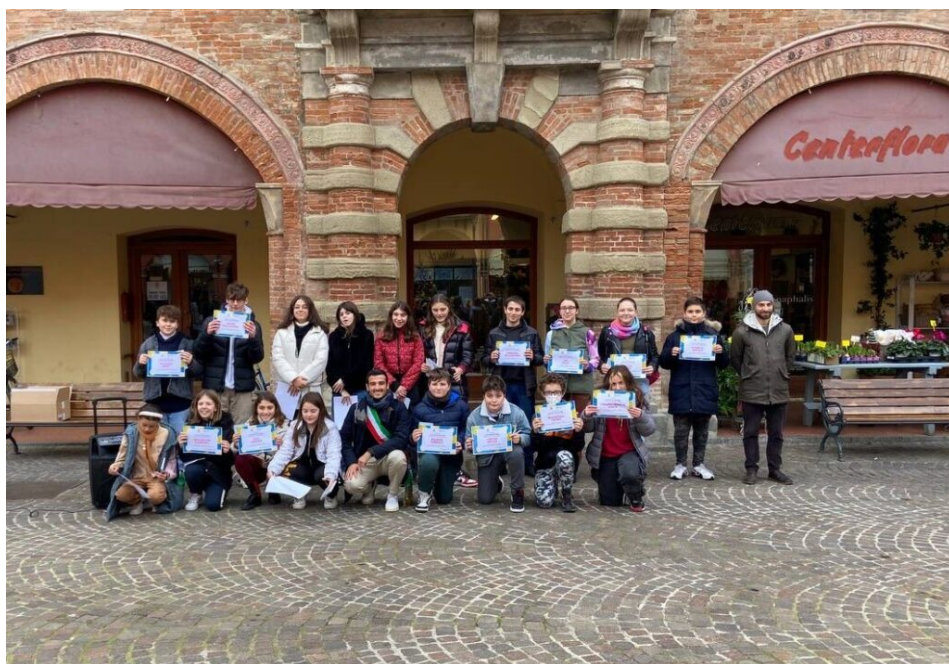
Commissione 4 - Ambiente, natura e spazi verdi