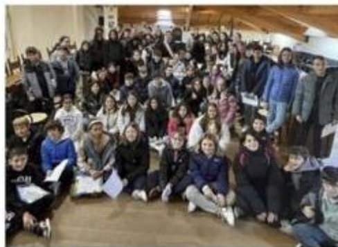
l.g. Gli oltre 70 consiglieri del futuro riuniti prima in Piazza Guercino e poi in Comune

e ai ragazzi una copia della Costituzione, un gesto semplice ma significativo per conoscere le basi della nostra storia». E non mancano i ringraziamenti. «Dagli Uffici dei servizi scolastici alla cooperativa Bangherang, ai dirigenti e i docenti che rendono possibile tutto questo. Ciò significa per noi essere una comunità educante, che riunisce le forze per creare progetti di lungo respiro, che siano formativi per le cittadine e i cittadini del presente e del futuro». Nel pomeriggio, invece, è stata occasione per presentare i pacifici realizzati dalle scuole di Bevilacqua.