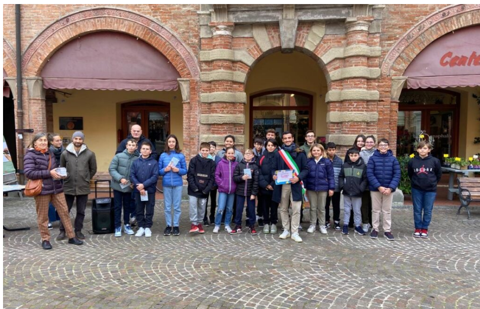
Commissione 2 – Beni comuni, cultura e turismo